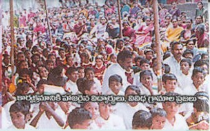
కార్యక్రమానికి హాజరైన విద్యార్థులు, వివిధ గ్రామాల ప్రజలు